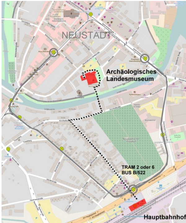
Karte: Joachim Müller, Foto der Wandmalerei in St. Johannis von Susanne Nitsch, Strichzeichnungen von den Details von St. Johannis: KDM 1912

Tagungsort: Archäologisches Landesmuseum im Paulikloster in Brandenburg an der Havel Neustädtische Heidestr. 28 14776 Brandenburg an der Havel, Vortragsraum im 2. Obergeschoss