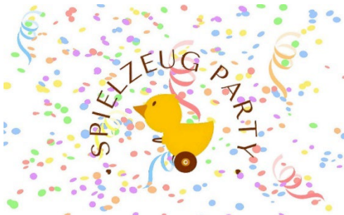
Abb2: Grafik: Stadtmuseum Brandenburg an der Havel

Altersempfehlung: 5–10 Jahre und Familien /Unkostenbeitrag: 1€ Anmeldung: Tel. 03381/584501 oder museum@stadt-brandenburg.de Ort: Frey-Haus, Ritterstraße 96, 14770 Brandenburg an der Havel