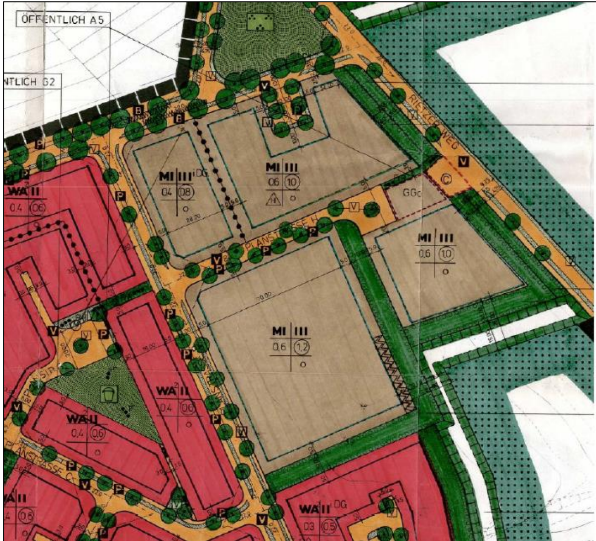
Ausschnitt aus der Planzeichnung des B-Plans Nr. 1 „Rietzer Weg / Heerstrasse“