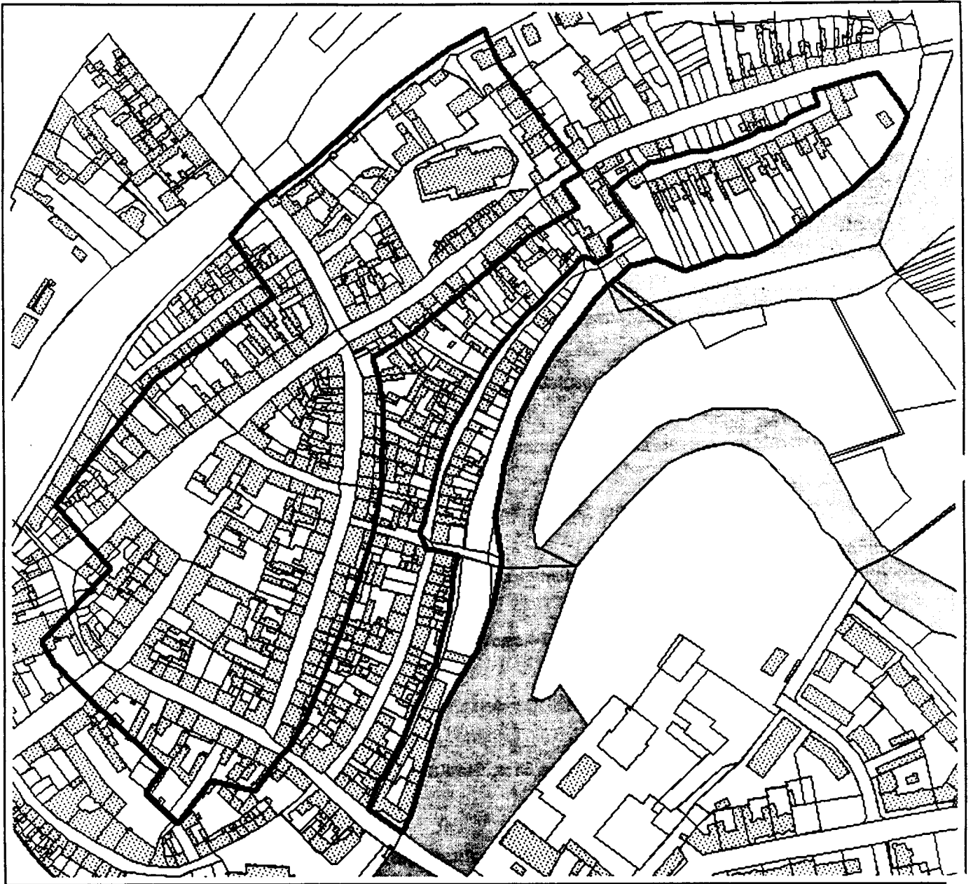
Denkmalbereiche: Stadtkerngebiet Altstadt und Altstädtischer Kietz - Uferbereich