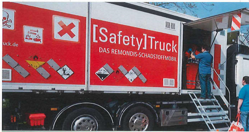
gültig für den Zeitraum vom 01.01.2019 bis 31.12.2019

Stadt Brandenburg. Umweltbewusstsein an der Havel